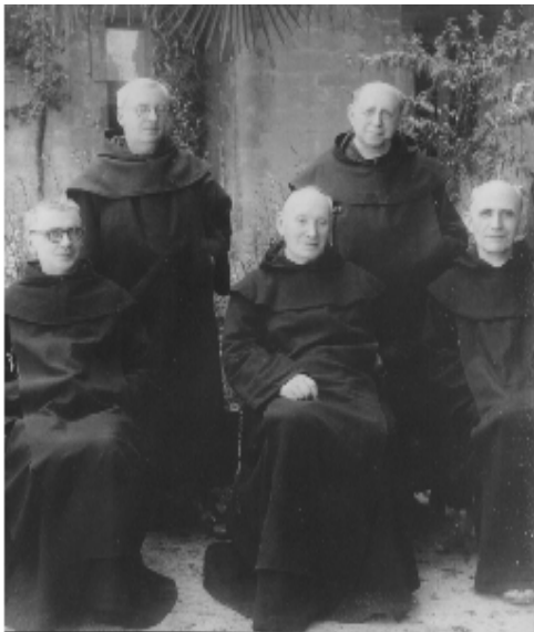
Con el P. Silverio, general de la Orden en 1948