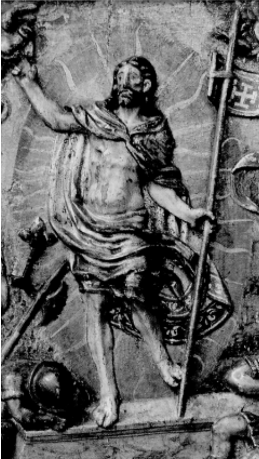
Cristo Jesús resucitado