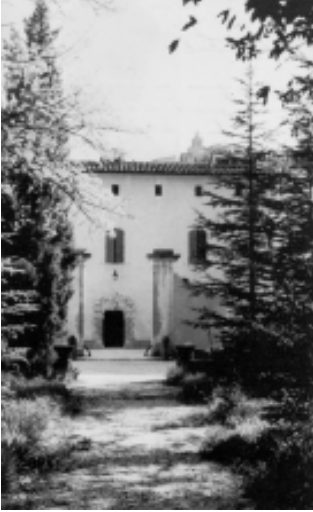
Primer edificio de la fundación Notre-Dame de Vie (Francia)