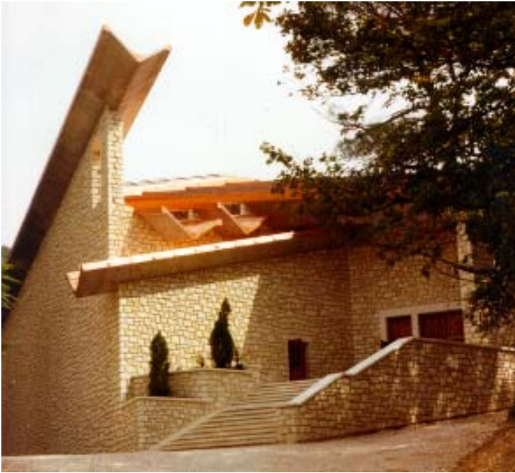
Capilla de Santa Emerenciana en Notre Dame de Vie

A Emerenciana le debió impresionar de manera singular el testimonio de fe y fuerza de su amiga, con la que había convivido y compartido el alimento materno y las ternuras de la vida familiar. Se puede comprender que Emerenciana se sintiese impulsada a dar el mismo testimonio que su amiga, si se le ofrecía la ocasión. Y la ocasión se presentó bien pronto.