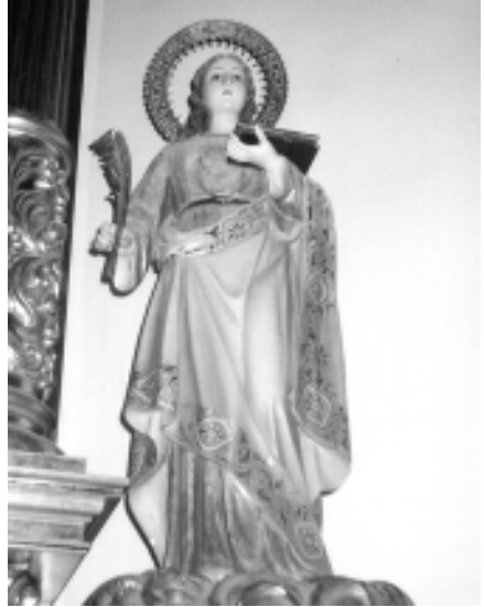
Santa Emerenciana en la Iglesia de Puebla de Valverde

Entre los cristianos martirizados encontramos a Inés, una jovencita de 13 o 14 años bautizada, dulce, pura y dócil como un corderillo, pero más valiente que un león. Fue decapitada el día 21 de enero del año 304 (hace ya 17 siglos). Sus padres recogieron su cuerpo y lo sepultaron en la hacienda que poseían en la via Nomentana, extramuros de la ciudad.