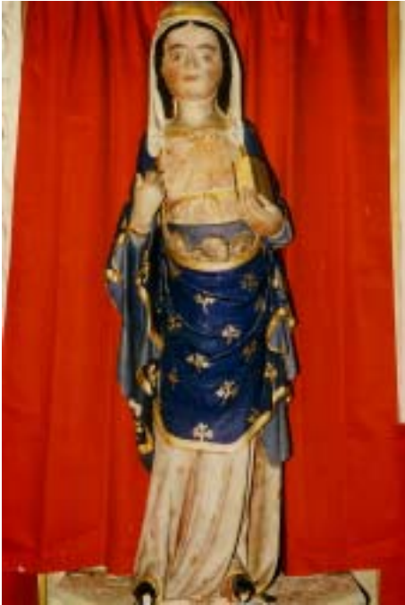
Santa Emerenciana en la Pouëze

dueña . Así pues, ella que no había tenido tiempo de recibir el bautismo de agua, fue bautizada en su propia sangre.