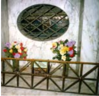
Sepulcro de Santa Emerenciana y Santa Inés

Su cuerpo fue sepultado en el cementerio mayor y más tarde depositado en un sepulcro contiguo al de santa Inés. Finalmente en 1615, el Papa Pío V depositó los restos de Inés y Emerenciana en un mismo relicario de plata que se puede venerar en la catacumba de santa Inés, bajo el