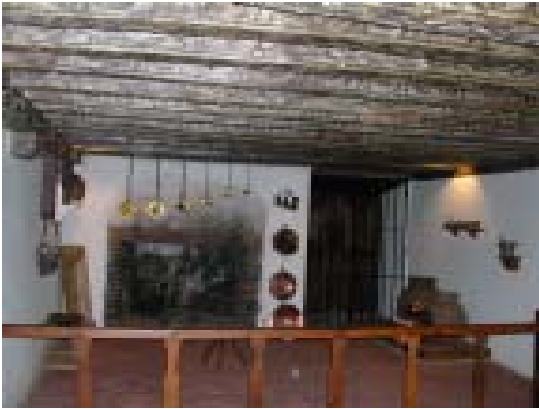
Cocina de Sta. Teresa en el monasterio de la Encarnación.

personal y su soledad para fundar monasterios dedicados a la oración dolorosa por la Iglesia, y extiende su Reforma a los religiosos, para llevar a cabo por medio de ellos lo que su condición de mujer le prohíbe hacer en favor de las almas. Esta contemplativa se carga de innumerables preocupaciones y se convierte en una fundadora con quien uno se puede encontrar en todos los caminos peligrosos de España.