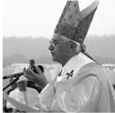
Benedicto XVI en la homilía del encuentro.

Es difícil compartir lo que vivimos durante 21 días cuando fuimos con 320 jóvenes de peregrinación hacia Colonia.