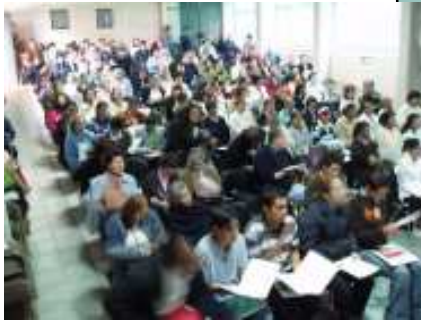
Toluca Junio 2007 - México