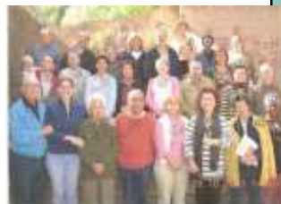
Desierto de Las Palmas (Benicasim) Octubre 2007 - España