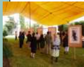
Toluca Junio 2007 - México