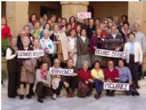
Segovia Febrero 2008 - España